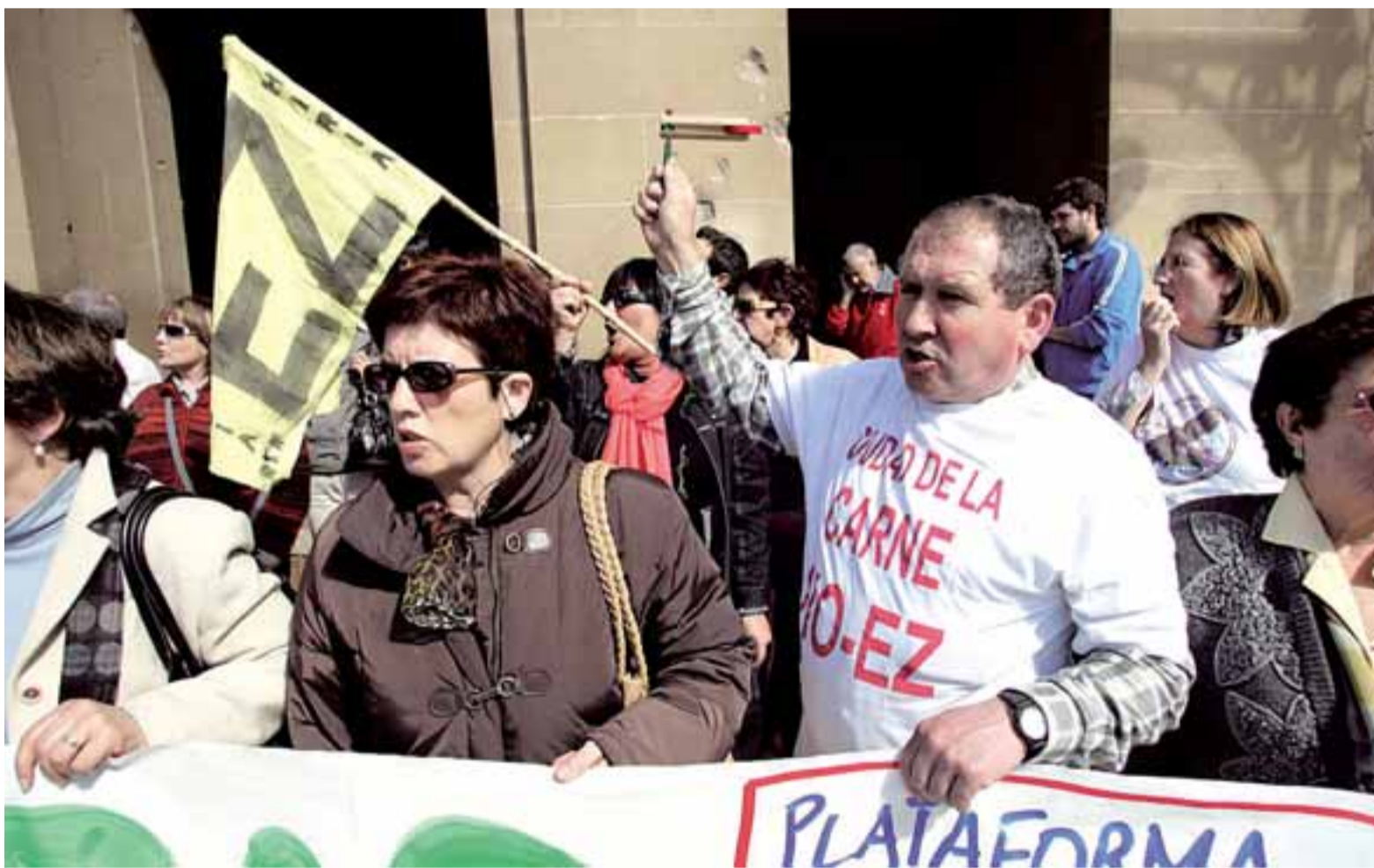
Vecinos de Valdizarbe que se oponen a la Ciudad de la Carne protestan, ayer, ante Diputación.