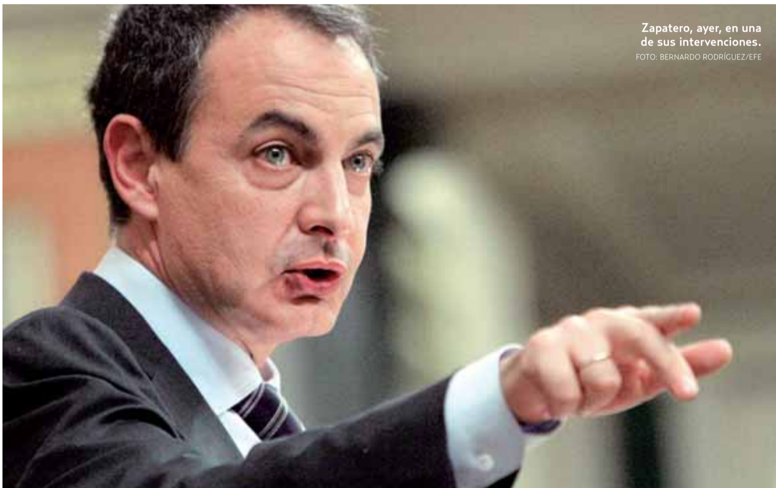
Zapatero, ayer, en una de sus intervenciones.